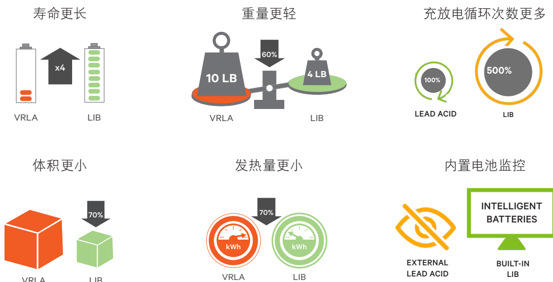
锂电池与铅酸电池对比

随着锂电池技术的成熟，锂电池产品寿命长、能量密度高、智能化等优势得以彰显。UPS+锂电的U锂融合方案成为新趋势。