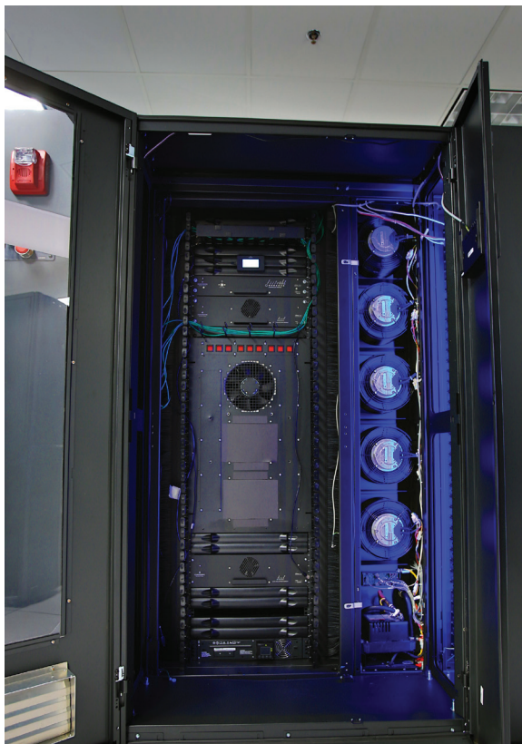
SmartRow MC DCX

Que vous soyez le responsable de l'exploitation des centres de données ou un architecte de centres de données, vous êtes responsable des armoires réseau de votre organisation. Et cela constitue un défi.